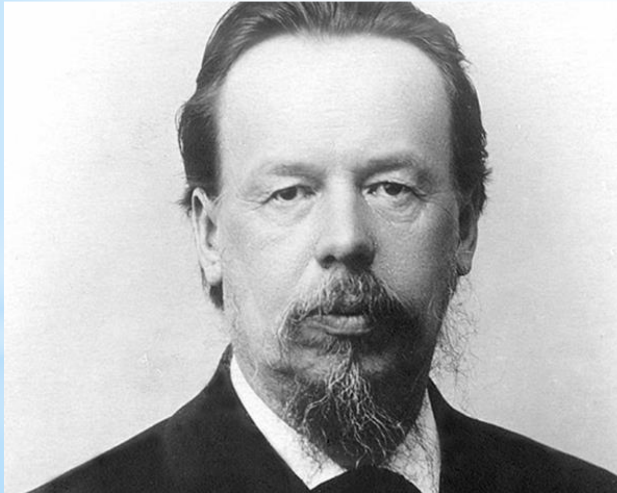
Александр Степанович Попов